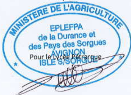
Éric VARNIER Proviseur

En cas d'échec de cette tentative, la juridiction compétente pourra être saisie à l'initiative de l'une ou l'autre des parties.